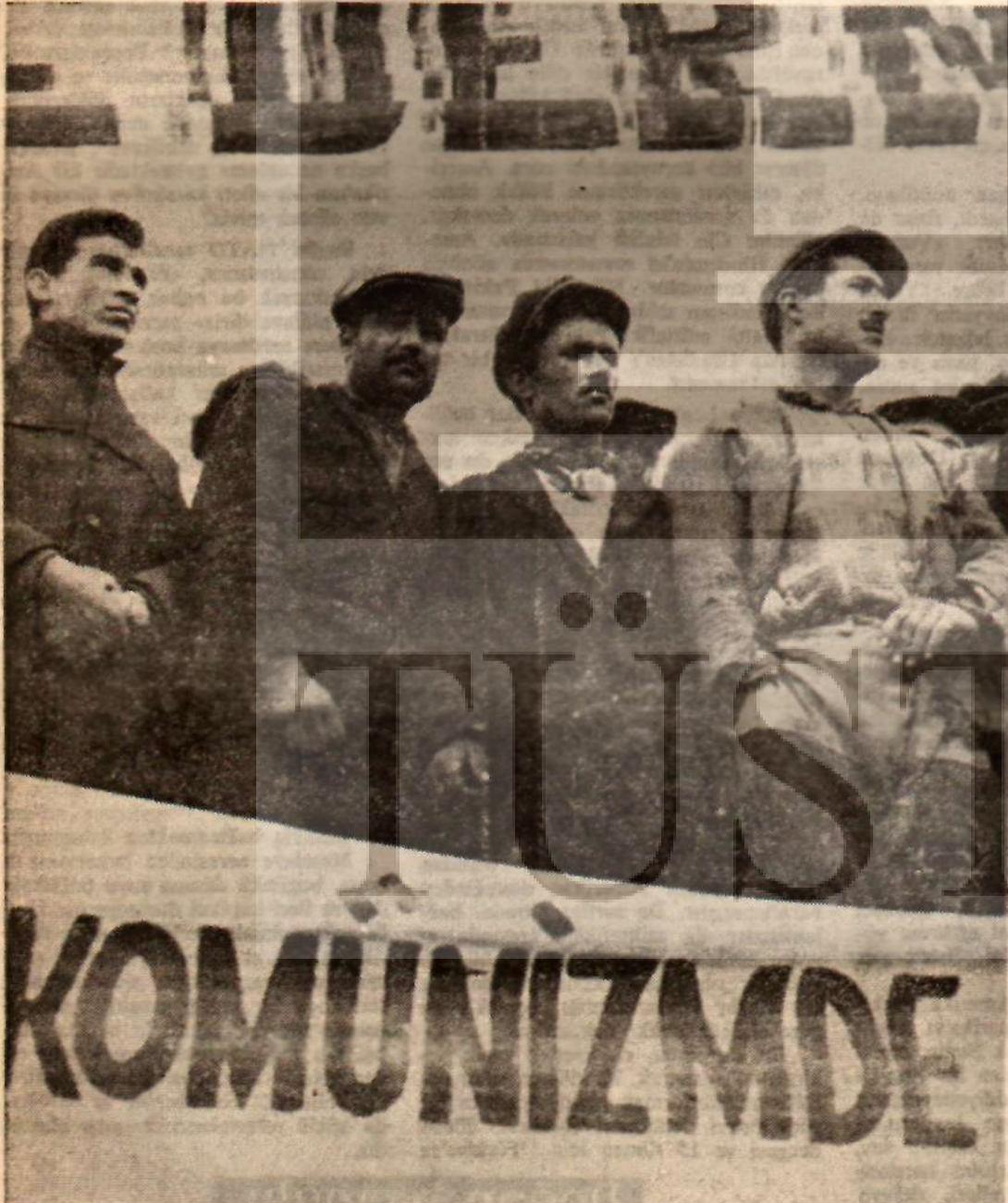
İstanbul mitinginden bir görünüş Kapitalizm savunucularına bakınız!

İlk safhada, muazzam bir Sovyet ordusunun karşısında, Amerikan atom bombaları vardı. Atlantik Päk-