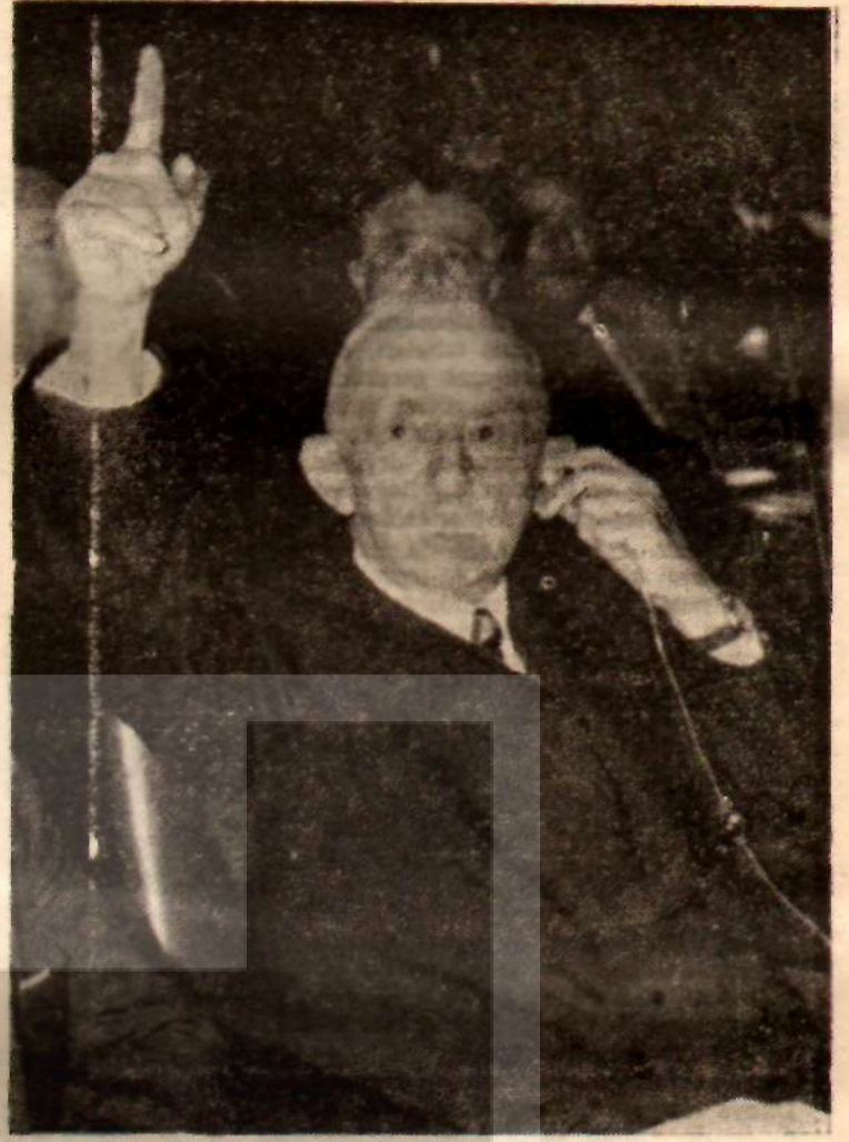
CHP Genel Başkanı İsmet İnönü «Tehlikeye doğru gidiyorsunuz»

Demirel'in İnönü'ye cevap verdiği gün, AP gençliği İstanbul'da miting yapıyordu. Aynı gün toplanan Parti Meclisinde CHP lideri İnönü, arkadaşlarına «İstanbul mitinginden haberinizi var mı?» diyor ve sözlerine şöyle devam ediyordu: «Benim var... Üç tane daha komünist keşfetmişler!...»